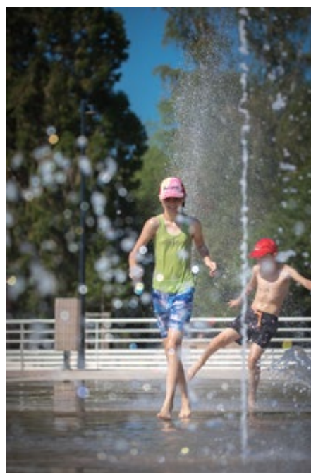
© AQUA PRO URBA 2019 - Saint Dié des Vosges (88) Parc public Simone Veil