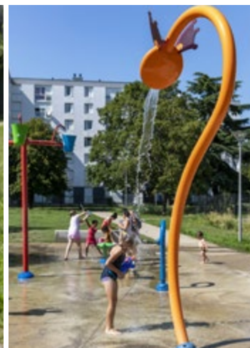
© AQUA PRO URBA 2021 - Réalisation d'une aire de jeux d'eau pour la ville de Soissons (02) - Installation avec filtrage (eau recyclée), optimisation de l'utilisation de l'eau qui est récupérée dans une cuve et réutilisée en continu, conforme aux normes piscine - Photos © Laurent Mayeux