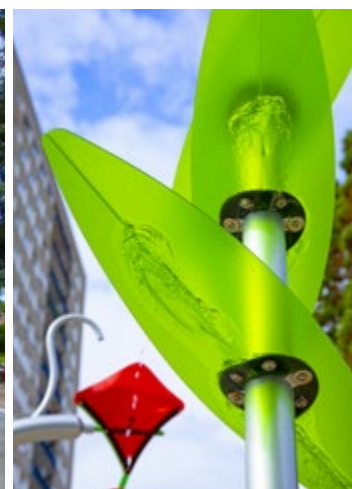
© AQUA PRO URBA 2021 - Réalisation d'une aire de jeux d'eau de 70m 2 pour le parc public de la ville de Maromme (76) Installation en basse consommation (eau perdue) pour rafraîchir les riverains, optimisation du fonctionnement du jeu et conforme aux normes ARS- Photos © Phillipe Turpin