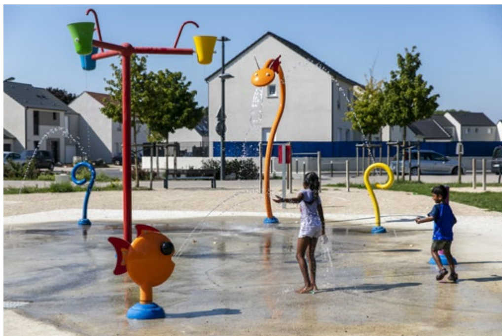
Soissons (02) - Parc public

Ainsi, si la tendance se poursuit, la vie en ville deviendra de plus en plus compliquée... C'est pourquoi les collectivités doivent mettre en place des solutions pour limiter l'impact des fortes chaleurs.