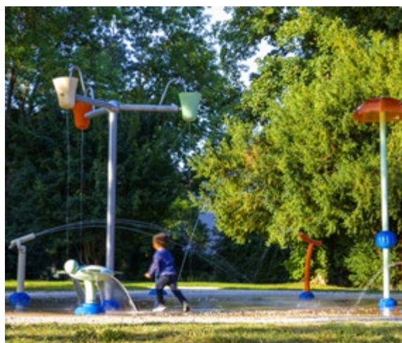
© AQUA PRO URBA 2021 - Réalisation d'aires de jeux d'eau de 100m 2 dans 5 parcs de la ville de Troyes (10) - Installations avec filtrage (eau récupérée), optimisation de l'utilisation de l'eau qui est récupérée dans une cuve et réutilisée par le service Espace Paysager et propreté de la ville, conforme aux normes ARS - Photos © Phillipe Turpin