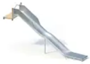
0-41850-701_CLASSIC Thème CLASSIQUE (standard catalogue)