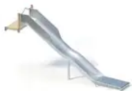
0-41848-701_CLASSIC Thème CLASSIQUE (standard catalogue)