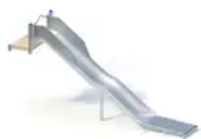
0-41846-501_CLASSIC Thème CLASSIQUE (standard catalogue)