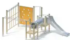
0-21185-704_JUNGLE Thème JUNGLE