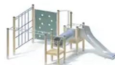
0-21185-704_OCEAN Thème OCEAN