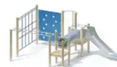
0-21185-704_PIRATE Thème PIRATE