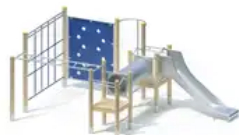
0-21185-704_SUNNY_DAY Thème SUNNY DAY