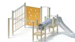
0-21185-704_SAFARI Thème SAFARI