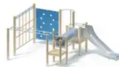
0-21185-704_SWEDEN Thème SWEDEN