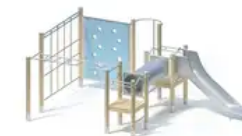
0-21185-704_ICE_PALACE Thème ICE PALACE