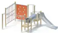
0-21185-704_ALOHA Thème ALOHA