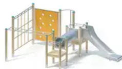
0-21185-704_BEACH Thème BEACH