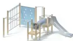
0-21185-704_MERMAID Thème MERMAID