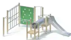
0-21185-704_NATURE Thème NATURE