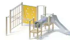
0-21185-704_CORAL Thème CORAL